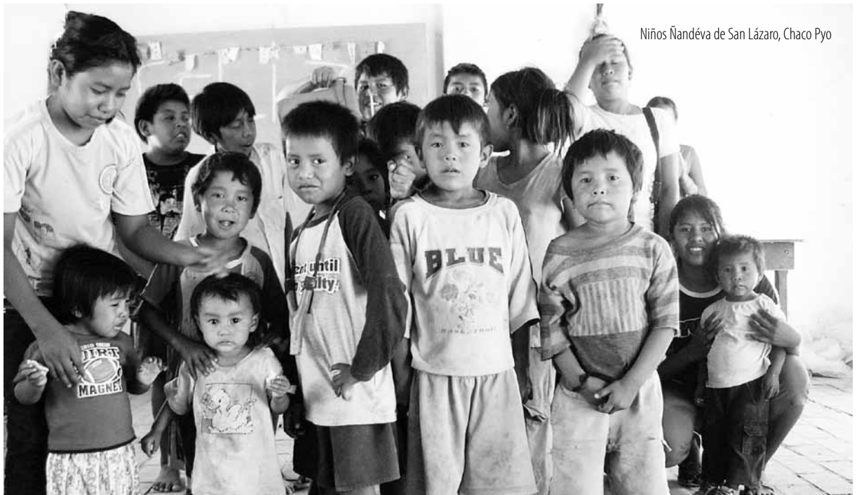
Niños Nandéva de San Lázaro, Chaco Pyo

La historia de genocidio, etnocidio y despojo hacia la población aborígen en América por parte de los grupos de origen europeo tiene relación en parte con la visión conquistadora propia de la cultura de los grupos llegados en confrontación con la visión de equilibrio y armonía cósmica propia de las culturas indo-americanas. La naturaleza de la cultura europea impulsa al despliegue hacia la dominación y la eliminación de los otros diferentes, mientras la proyección de la cultura indo-americana tiene más relación con sostener el equilibrio con los otros y con la propia naturaleza. En situaciones de dominio por parte de un grupo de conquista la resistencia de los pueblos originarios se da principalmente a través del repliegue o de la mimetización, a modo de encubrir su diferencia rechazada.