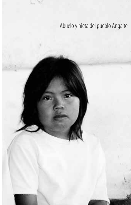
Abuelo y nieta del pueblo Angaité

ción de la problemática indígena, cuenta hoy en la conducción con una persona de reconocida trayectoria en defensa de los derechos de los pueblos indígenas y de la cual se espera con ansiedad una mejor gestión en la institución. Sin embargo, le espera una dura lucha ante la corrupción instalada en la institución y donde posiblemente el 98 % del funcionariado tiene alguna responsabilidad con esa situación.