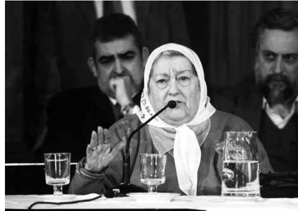
Hebe de Bonafini, de Madres de Plaza de Mayo junto a Néstor Busso de FARCO, en una de las audiencias en el Senado .

Incorpora la cuestión de género como uno de sus objetivos: “Promover la protección y salvaguarda de la igualdad entre hombres y mujeres, y el tratamiento plural, igualitario y no estereotipado, evitando toda discriminación por género u orientación sexual” (Art. 3 Inc. m).