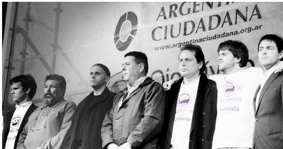
Acto de sectores opositores a la ley de medios