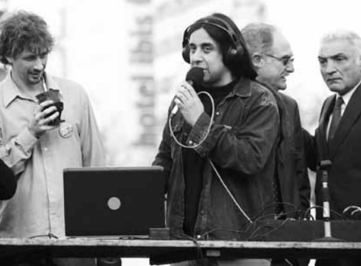
Radio abierta con integrantes de la Coalición por una Radiodifusión Democrática