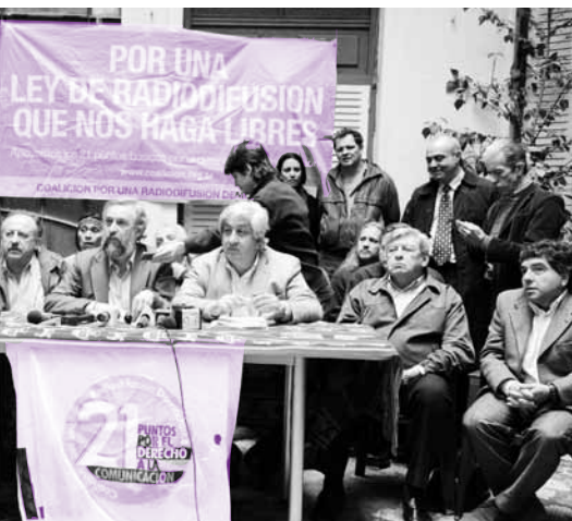
Conferencia de prensa de la Coalición por una Radiodifusión Democrática con algunos de sus integrantes