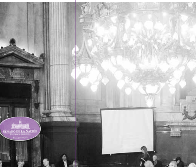
Senadores en las audiencias

El resultado del trabajo con consenso, desde el campo popular es la ley 26.522, veintiséis años después. Miles de hombres y mujeres que participaron y lucharon para que nuestro país lograra darle voz a los que nunca la tuvieron. De eso se trata, de usar la palabra para conformar nuestra propia identidad como individuos pertenecientes a una nación y un continente que todavía busca su autodefinición, doscientos años después.