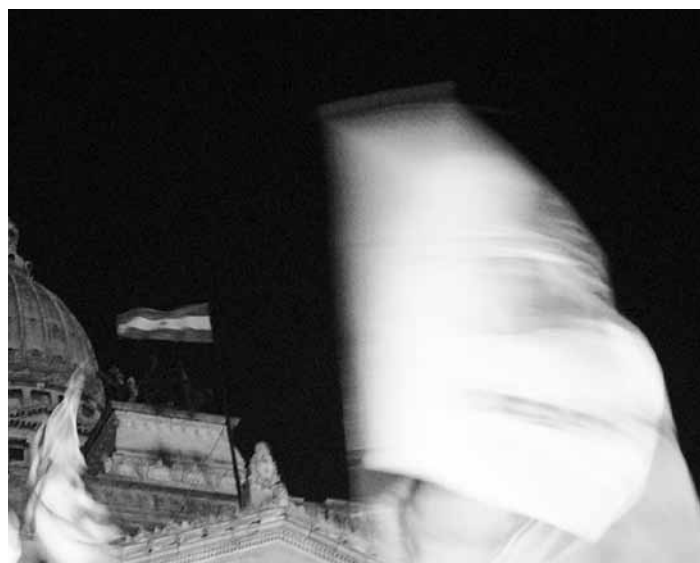
Frente al Congreso Nacional la gente festejó la aprobación de la ley